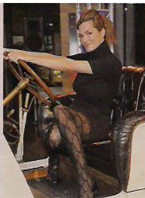
Alexandra Kamp will nicht immer nur auf ihr Äußeres reduziert werden. Aber diese Beine ...